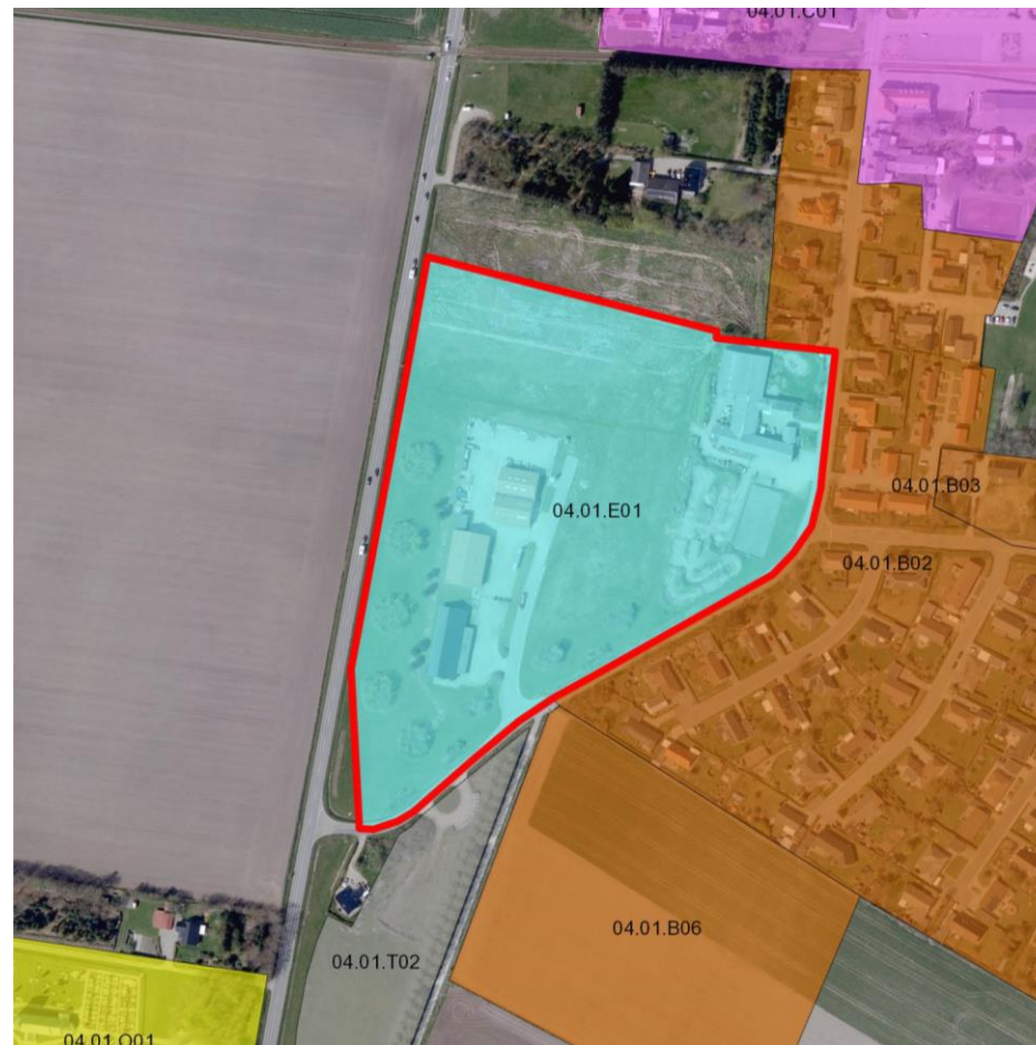
Figur 1: Afgrænsning af rammeområde 04.01.E01 til erhvervsområde. Der sker ingen ændringer af rammeområdets afgrænsning.

Lokalplaner, der træffer bestemmelser for rammeområde 04.01.E01, skal være i overensstemmelse med de bestemmelser, der er indeholdt i bilag 1, Tabel 1.